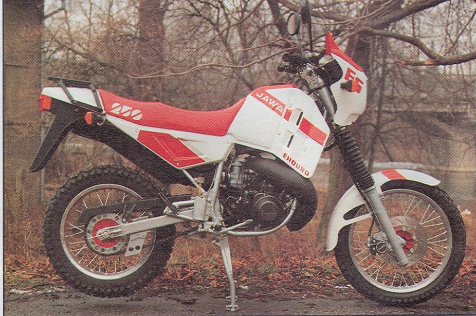
▲ Jawa 250 off-road má nejbliže k enduro motocyklu